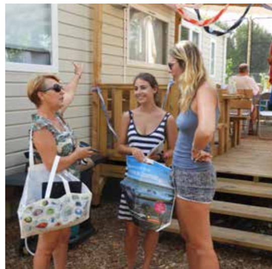
L'été, sensibilisation des vacanciers au tri