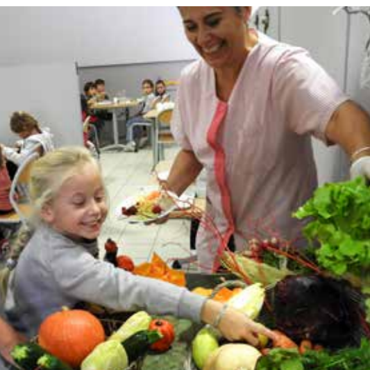
Buffet découverte des légumes au restaurant Séverin