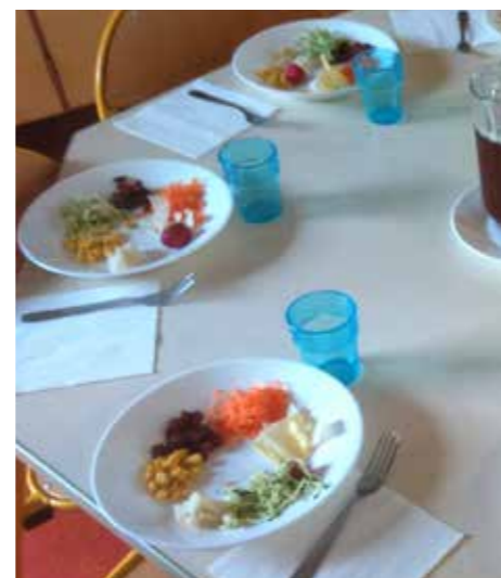
Ronde de crudités à la maternelle Tabarly