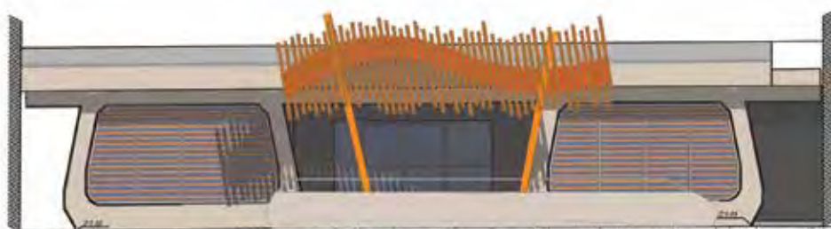
Réhabilitation du restaurant scolaire Le Repausset-Levant : l'entrée du public sera habillée d'un avant en bois et en métal

Plus d'infos sur le projet sur www.terredecamargue.fr