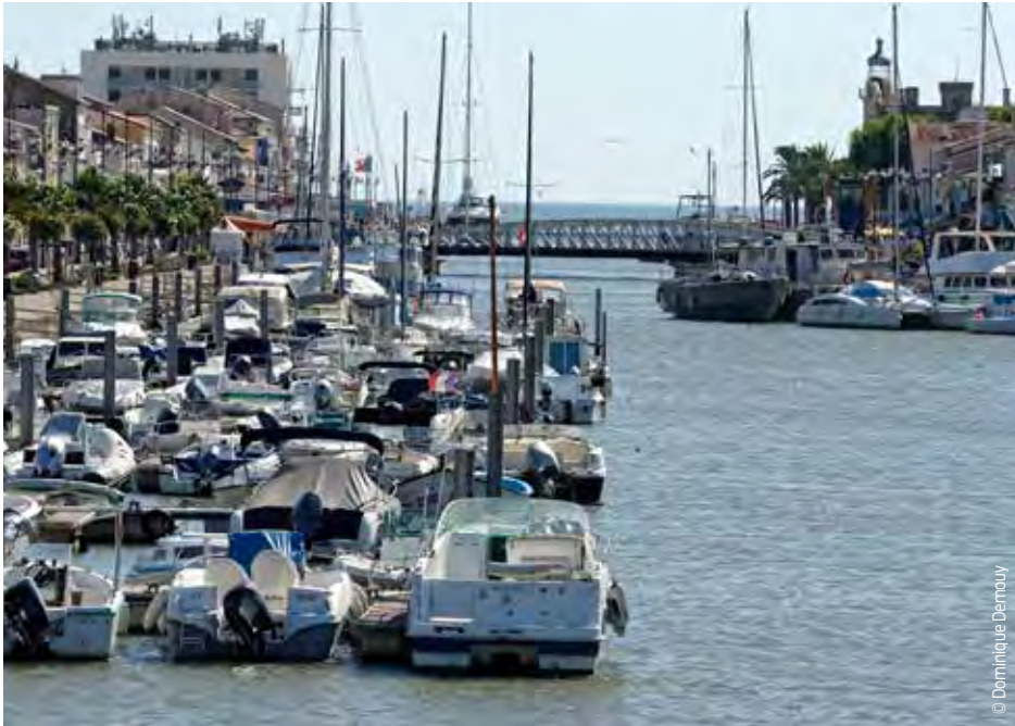
Le port de plaisance au Grau du Roi