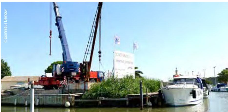
Le chantier naval Constance Boat

En 2015, la Communauté de communes a programmé 775 000 € HT de travaux d'aménagement. Le projet phare est celui du prolongement de la promenade du quai des Croisades à Aigues-Mortes qui s'inscrit pleinement dans cette volonté de tisser des liens entre la mer et la terre ( lire-ci-contre ). Il est aussi prévu de refaire le revêtement du quai des remparts. Avant la saison estivale, 80 mètres de pontons flottants ont été réhabilités sur les deux ports. Enfin, une réflexion est en cours pour agrandir le port d'Aigues-Mortes et créer 20 à 25 anneaux supplémentaires. Cela permettrait aussi d'accueillir une base de location de pénichettes pour répondre à la demande de plus en plus forte des plaisanciers pour ce type de service.