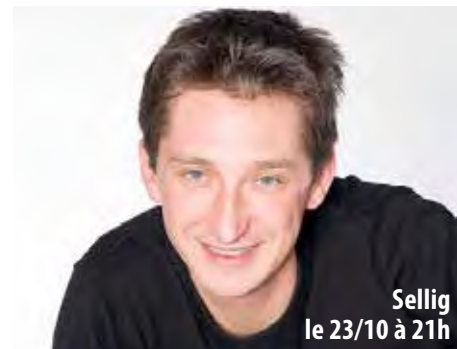
Sellig le 23/10 à 21h

LE MOIS DU RIRE 23 octobre au 27 novembre à 2012 Festival humour - Espace Jean-Pierre Cassel, Palais des sports et de la culture