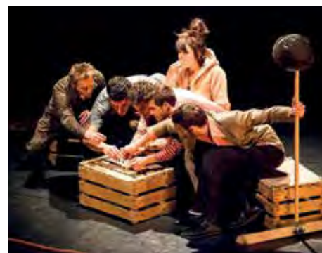
La compagnie Lapsus six pieds sous terre

Plus d'infos : Office de Tourisme, 04 66 51 67 70 et sur www.meetingtheodyssey.eu/fr